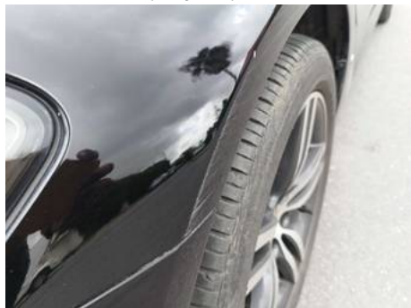
Aile avant gauche (Rayure)